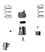
Quick release kit (optional)

THE REAL "WORK-HORSE" FOR YOUR TYRE SHOP!!