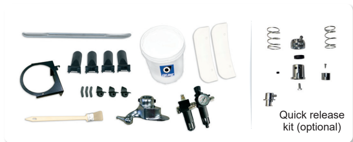
Quick release kit (optional)