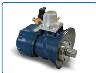
Gruppo vite con valvola di aspirazione.