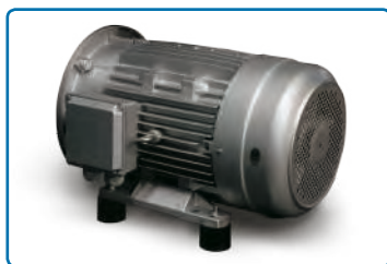
Motore elettrico con antivibranti.